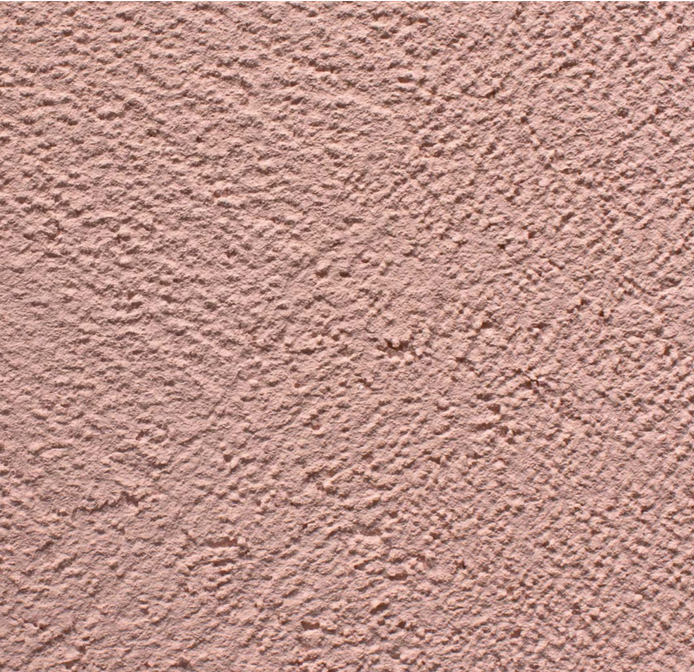
StoSignature Texture: Rough 30 (Stolit® Effect, R17 65 22 Altes Rot)

Um die Vision der „Farben Kölns“ ins Material zu bringen, trafen sich Prof. Heuchel und Martin Bachem zu einem Workshop am Sto-Hauptsitz. Gemeinsam mit StoDesign wurden Putze angemischt und aufgetragen und Texturierungen praktisch erprobt. Ziel war, Oberflächen zu entwickeln, die optisch wie haptisch überzeugen und sich wirtschaftlich in großem Maßstab umsetzen lassen. Aus dem Prozess resultierten zwei Texturen der StoSignature Systematik: Rough 10, ein hochgerollter Putz mit grober Körnung, und Rough 30, ein grober Putz, kreuz und quer auf Korn abgezogen. Beide Varianten verbinden hohe Ausführungssicherheit mit einem lebendigen Erscheinungsbild. Sie zeigen die Spuren der handwerklichen Verarbeitung und verleihen Fassaden einen wertigen, individuellen, nie uniformen Charakter.