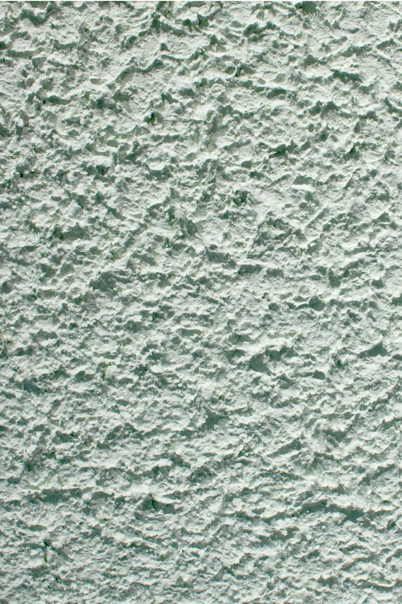
StoSignature Texture: Rough 10 (Stolit® Effect, Y01 84 08 Kölnisch Grün)