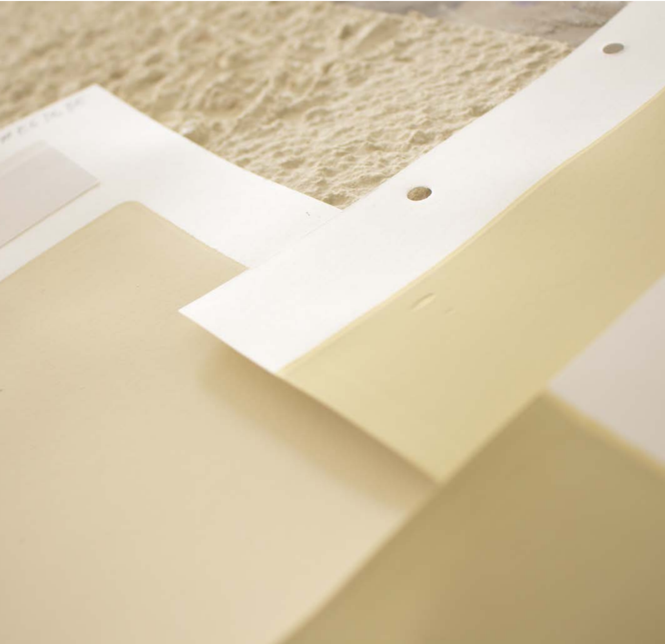
Muster aus der Sto-Farbmatrik (Domgold)